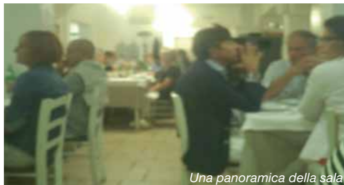
Una panoramica della sala