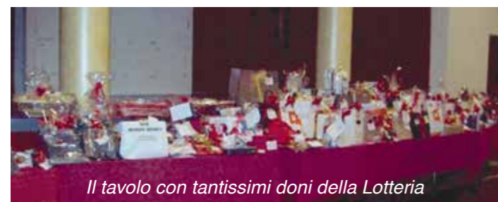
Il tavolo con tantissimi doni della Lotteria