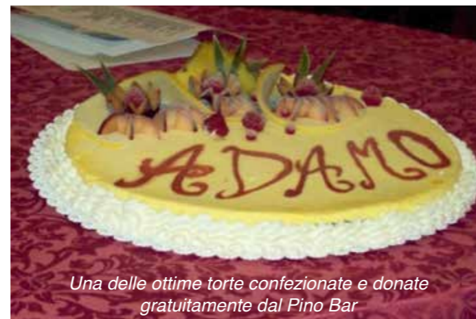
Una delle ottime torte confezionate e donate gratuitamente dal Pino Bar