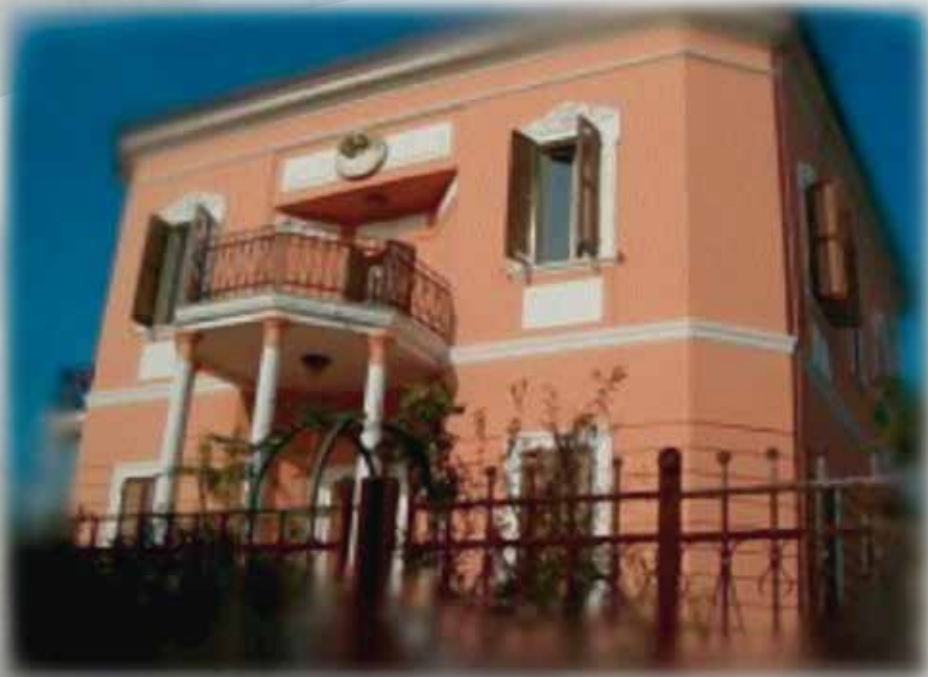
La Sede A.D.A.M.O.